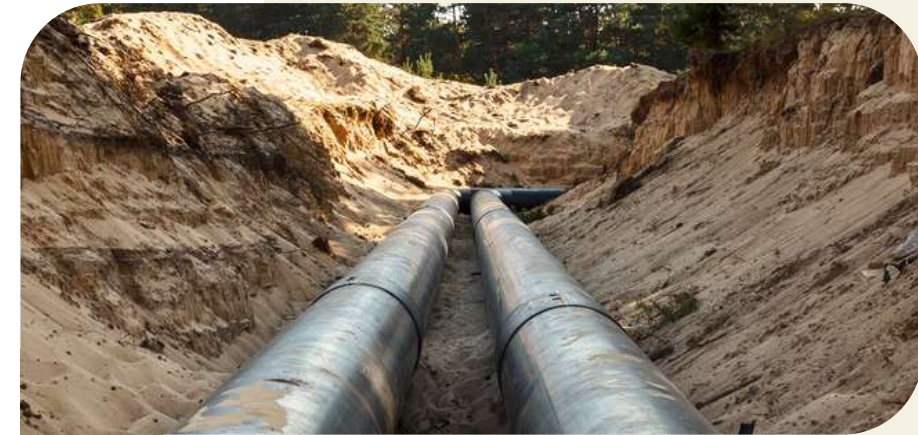
Kabel & Leitungen