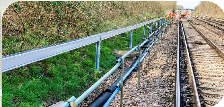
Schnell- und Bahnstrecken