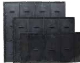
Toepassing van lage panelen (30, 45 of 60 cm hoog)