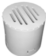
Endkappe Schraubkappe bio Ø 80 mm 100% biologisch abbaubar Typ: CNES80