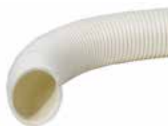
Bewässerungsrohr/Belüftungsrohr bio Ø 80 mm 50 m 1 pro Rolle 100% biologisch abbaubar Typ: CNBS80 Typ: CNBSK80 (mit Kokosstrumpf)