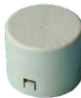
Klickendkappe bio Ø 80 mm 100% biologisch abbaubar Typ: CNEK80