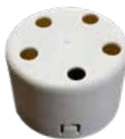
Kickendkappe bio mit Belüftungslöcher Ø 80 mm 100% biologisch abbaubar Type: CNEG