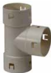
T-Stück bio 80 x 80 x 80 mm 100% biologisch abbaubar Typ: CNT80