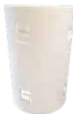
Doppelsteckmuffe bio Ø 80 mm 100% biologisch abbaubar Typ: CNMK80